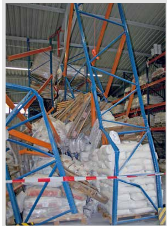
Regaleinsturz in Wunsiedel