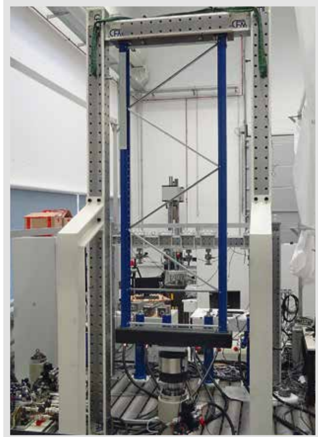
Testaufbau Palettenregalrahmen, gerichtet, mit Pfostenverstärkung, ca. 1000 mm Höhe, Material: 4 mm Stahlblech

Abhängig von dem verwendeten Rahmentyp zeigte sich, dass alle drei Varianten im Vergleich zum Original-Rahmen statisch gleich belastbar, meist sogar stabiler sind.