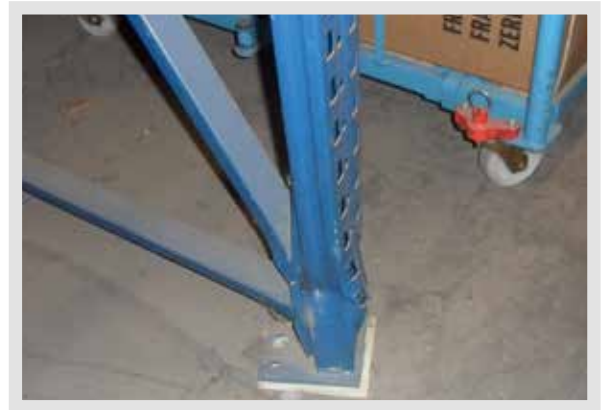
beschädigter Regalrahmen der Stufe ROT