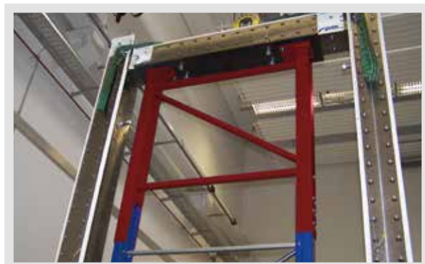
Testaufbau Palettenregalrahmen, nach Entfernung der Pfosten versehen mit Unterbauständer, Material: 5 mm Stahlblech